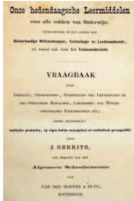
Titelblad Onze hedendaagsche leermiddelen

Een nieuw museum De bovengeciteerde uitroep van journalist Van Waalwijk met de kenmerkende toonzetting van de tweede helft van de negentiende eeuw - zo rijk aan ontdekkingen en technische vernieuwingen - blijkt niet helemaal waar te zijn. Op 24 december 1877 was te Amsterdam in het Paleis voor Volksvlijt al het Nederlandsch Schoolmuseum geopend. De beide oprichters van het Rotterdamse Museum voor Onderwijs en Kunst kozen echter een andere opzet. Naast de voor een school- of onderwijsmuseum gebruikelijke zaken vond men er de resultaten van de nieuwste ontwikkelingen op het gebied van de techniek: een morseapparaat, stoommachines, een hete luchtmachine en zelfs een 'indompelingsbatterij van 8 elementen, waarmee de elektrische lamp in verbinding staat'. 2 Volgens Van Waalwijk was dit onderwijsmuseum niet interessant voor de oudheidkundige, want het bood 'geene opeenstapeling van werktuigen waarmee men in vroeger tijden de leer-