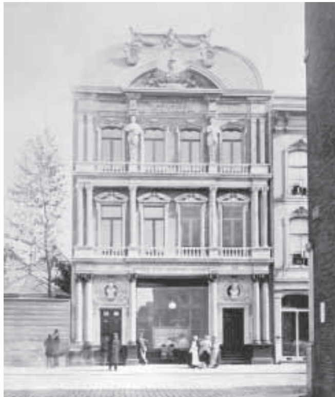
Lithografie van Museum voor Onderwijs en Kunst circa 1880