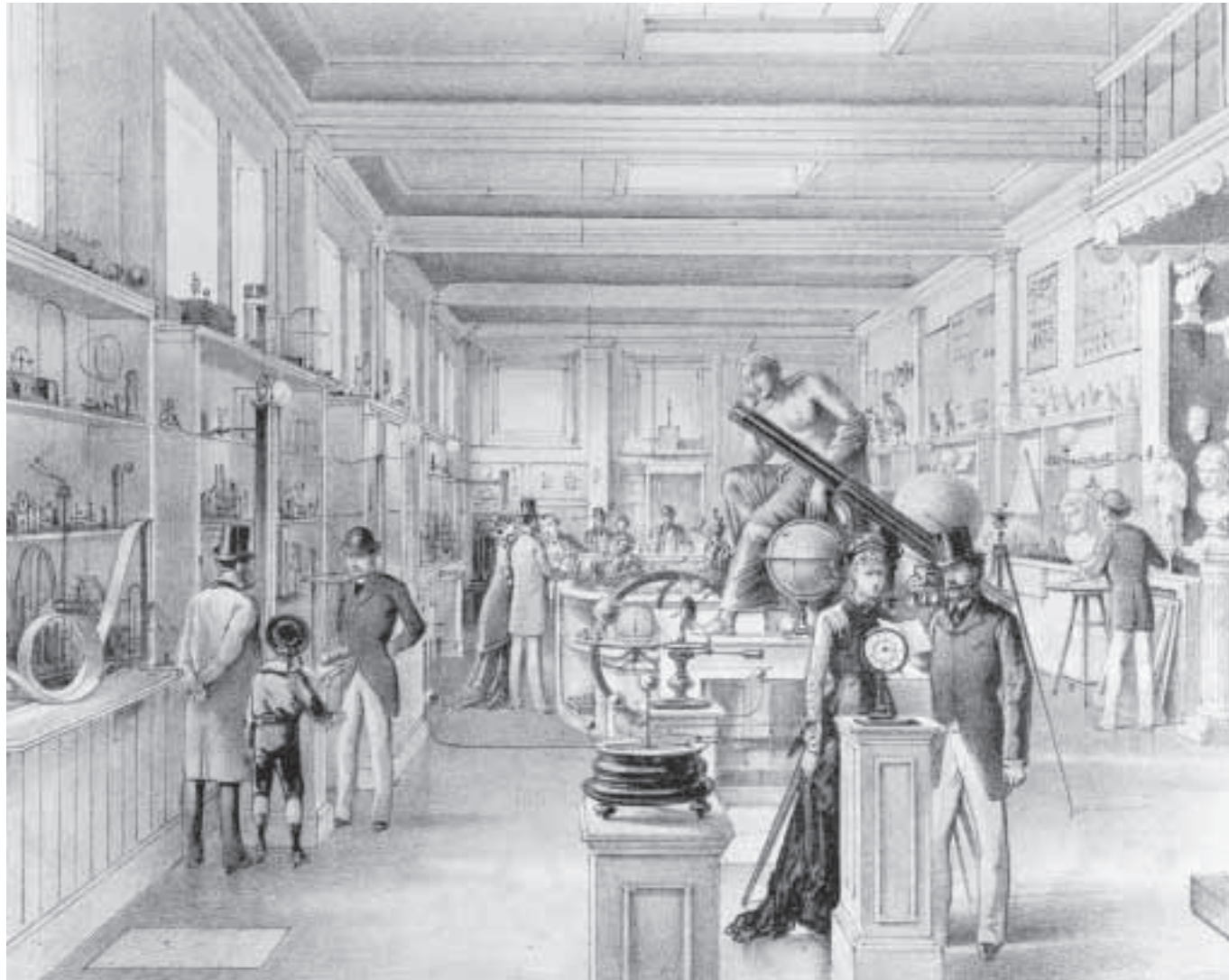
Lithografie van de Onderwijszaal, circa 1880

Van Waalwijk besteedde in zijn artikel veel aandacht aan electriciteit en het belang ervan: