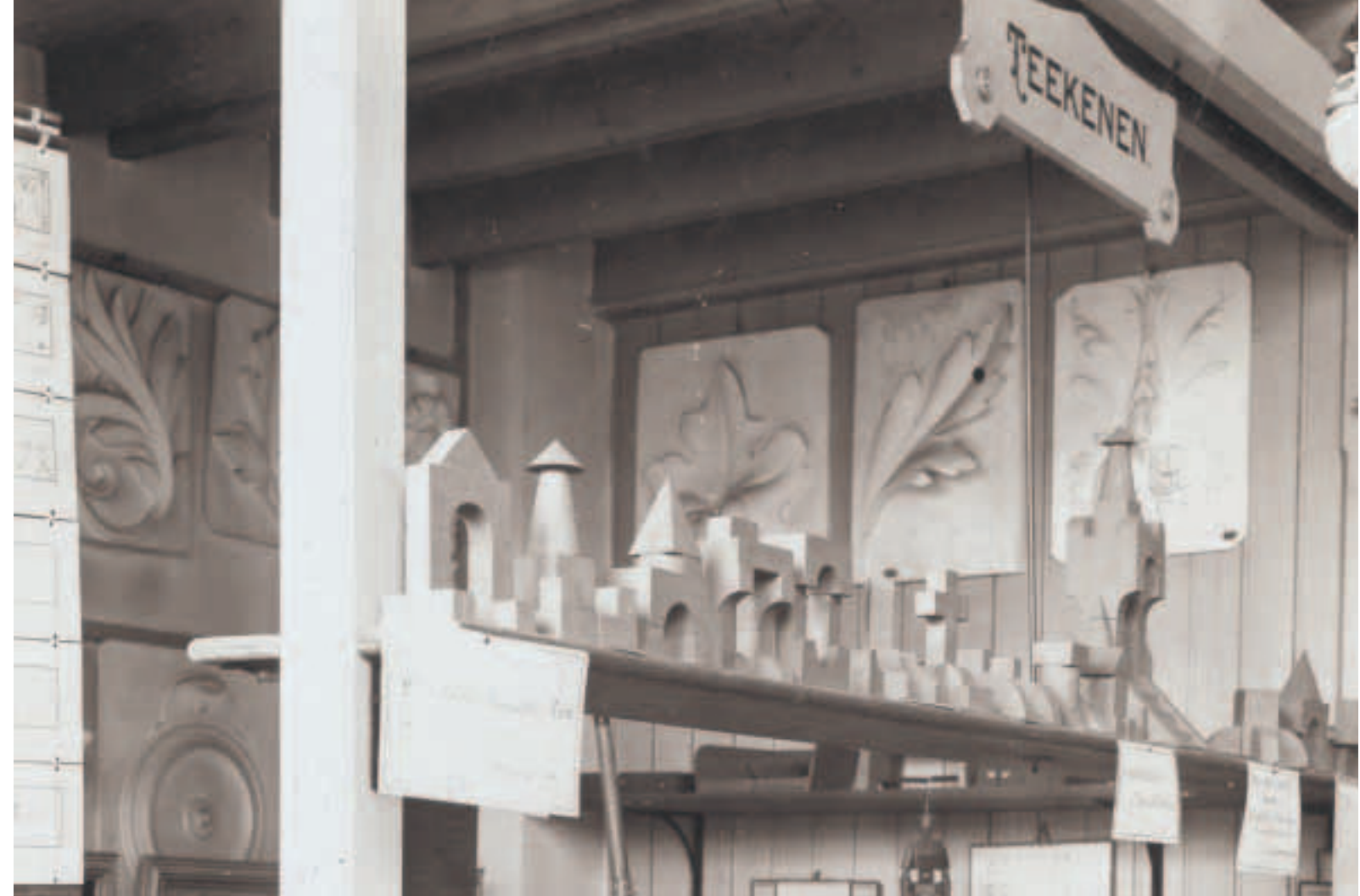
Deel van het Appartement van de afdeling 'Teekenen', circa 1910

In 1906 toen de Louise-Bewaarschool opgeheven werd, verkreeg het museum ook de benedenverdieping van het pand aan de Prinsengracht. In 1914 volgde de laatste uitbreiding met de voltooiing van de bouw van een zaal in de tuin van het pand. Toen bereikte het zijn grootste omvang, zo'n 750 m 2 , een oppervlakte die internationaal gezien niet gemakkelijk door een schoolmuseum gehaald werd. Een beschrijving van de directeur J. van der Esch in 1916 geeft een beeld van de inrichting van het museum na de uitbreiding. 26 Dit toont tevens hoe geleidelijk de belangstelling of prioriteitenstelling van de museumleiding is veranderd. Er zijn nu appartementen voor godsdienstonderwijs, beroepskeuze en examens en Nederlandse taal- en letterkunde aan de linkerkant toegevoegd. De rechterkant is aangevuld met hygiëne en gymnastiek. Eén van de twee afdelingen