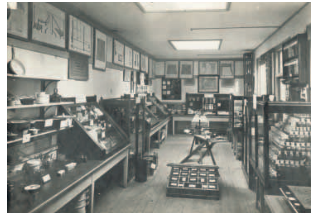
De afdeling voor het huishoud- onderwijs, geopend in 1914

schoolbenodigdheden en -boeken. In 1851 werd dit het Educational Museum van Ontario, maar al in 1856 werd deze onderwijsverzameling onderdeel van het Canadian Museum van Toronto. Dit provinciale museum stond evenwel lange tijd in zijn geheel bekend als het Educational Museum. Het fungeerde als voorbeeld voor Amerikaanse schoolmusea.